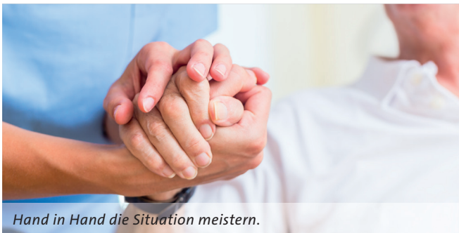
Hand in Hand die Situation meistern.

Die Palliativmedizin nutzt alle Möglichkeiten der modernen Medizin und Schmerztherapie, um Schmerzen weitest möglich zu nehmen und auftretende Beschwerden zu lindern. Für die Patienten ist dies eine große Erleichterung: Im fortgeschrittenen Stadium können die Schmerzen und Beschwerden so belastend sein, dass das Leben unerträglich scheint. Auf der Palliativstation erhalten Betroffene Hilfe, den letzten Abschnitt ihres Lebensweges in Ruhe und gut unterstützt gehen zu können.